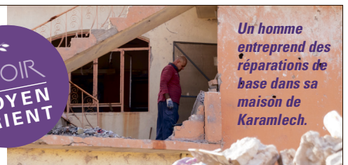
Un homme entreprend des réparations de base dans sa maison de Karamlech.

» Portes Ouvertes travaille en Irak depuis plus de vingt ans. Entre 2014 et 2016, en collaboration avec nos partenaires, nous avons soutenu des centaines de milliers de chrétiens avec du secours d'urgence.