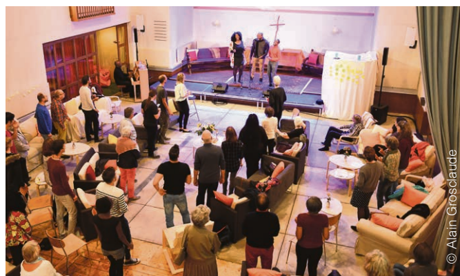
La première célébration inclusive du Lab a rassemblé une soixantaine de personnes le dimanche 24 septembre.

Au Lab, le mot d'ordre est « l'inclusivité ». Chacun est le bienvenu, quels que soient son genre, son origine, son orientation affective, ses convictions, ou son identité religieuse. Lancée dès les débuts du Lab, la dynamique Antenne LGBTI (lesbiennes, gays, bisexuels, transgenres et intersexes) a rapidement trouvé son public (voir ci-dessous). Depuis, d'autres propositions ont vu le jour, que ce soit les soirées « Soif de sens » pour échanger et entrer en résonance à partir d'un texte, ou les moments de méditation, avec notamment un temps de silence nourri d'un enseignement spirituel ou d'une Parole.