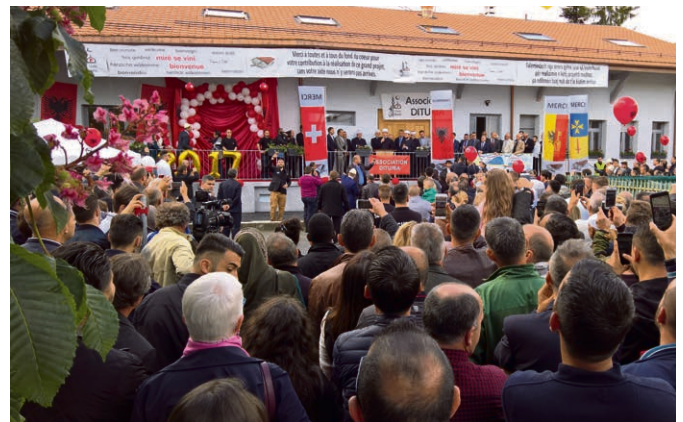
En mai dernier, les portes-ouvertes organisées par la Plateforme, à l'occasion de l'inauguration du centre culturel islamique de Dituria à Plan-les-Ouates, ont attiré plusieurs centaines de personnes.

La Plateforme a également rédigé « 9 propositions pour vivre ensemble et se respecter ». Elle a aussi contribué à la création de deux parcours interactifs passionnants qui invitent à la découverte de quelques-uns des nombreux « objets du sacré » de la collection permanente du Musée d'ethnographie (MEG). Inaugurées en début d'année, ces visites sont conçues sous la forme d'une chasse aux trésors. Vous déambulez ainsi dans les salles, smartphone à la main ou avec la brochure disponible à la librairie du musée.