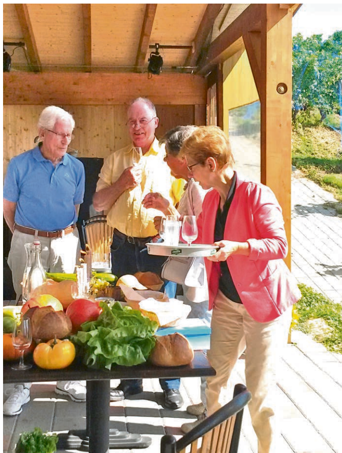
Vully - Avenches Cultes des Récoltes.

Dimanche 12 novembre, à 10h , à la salle du théâtre d'Avenches. Notre but : dynamiser, renouveler, alléger, garder le plaisir du partage et nous assurer un important apport financier pour les activités de notre paroisse. Comme l'an dernier, la vente paroissiale se déroulera sur une seule journée. Elle proposera un brunch bien garni et varié. Le culte sera intégré à la fête et aura lieu sur place, à la salle du théâtre. Vous trouverez toujours le stand pâtisseries, ainsi que la tombola. La Lyre nous fait l'honneur de participer à cette journée. Programme : 10h, accueil, thé, café, tresse ; 10h30, culte accompagné par la Lyre ; 11h30, apéro ; 12h, brunch.