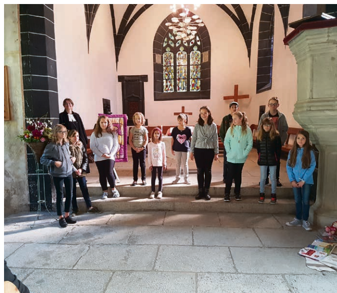
Curtilles - Lucens Ensemble pour vivre le culte d'ouverture du KT!

Samedi 25 novembre, dès 11h30 , à la salle communale de Villars-le-Comte: une sympathique manière de soutenir l'effort missionnaire de notre paroisse.