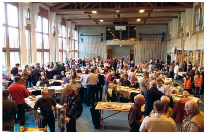
Oron - Palézieux Bienvenue à la fête paroissiale.

Venez en famille, tout est prêt pour vous accueillir.