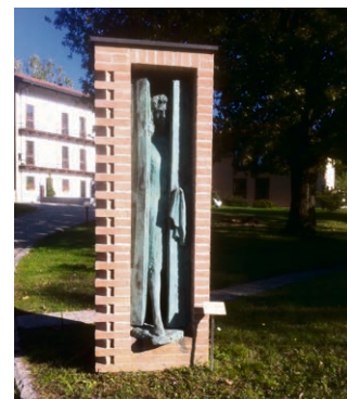
Granges et environs L'Attente, statue dans le parc du monastère de Bose.