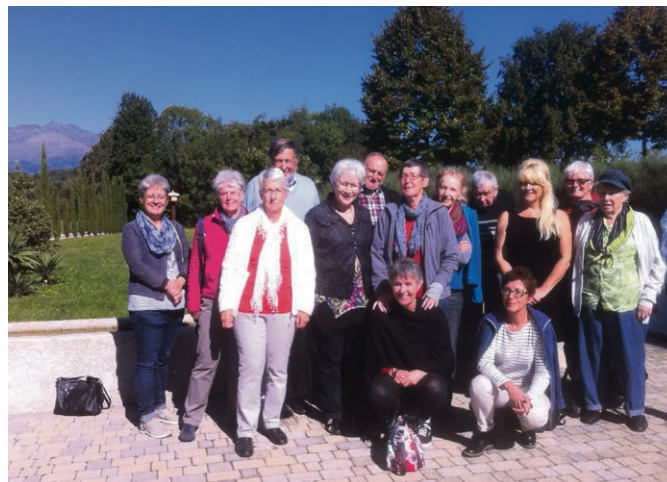
Granges et environs Le groupe en retraite au monastère de Bose...

Le mercredi 22 novembre, à la salle paroissiale de Granges, vous êtes invité à venir bricoler sur indications d'une fleuriste, une couronne de l'Avent que vous emporterez, et une que les catéchumènes vendront le samedi 25 novembre au profit d'un projet Terre Nouvelle. Deux horaires possibles : de 14h30 à 17h ou de 19h30 à 22h. Prix : 10 fr. pour le matériel, pour les personnes qui viennent confec-