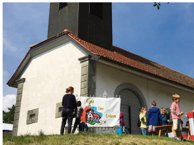
Eglise de Servion.

même si vous ne pouvez venir qu'une seule fois, vous y prendrez goût ! Des animatrices formées et compétentes vous accueilleront avec vos enfants dans l'enthousiasme et la sagesse de Jésus disant à