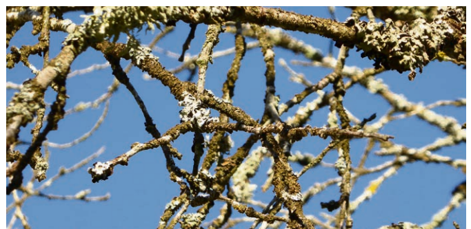
Jorat Culte du souvenir.