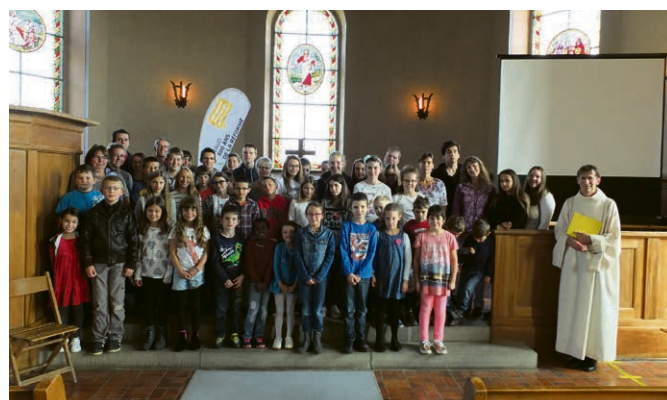
Oron - Palézieux Culte d'ouverture enfance KT R500.