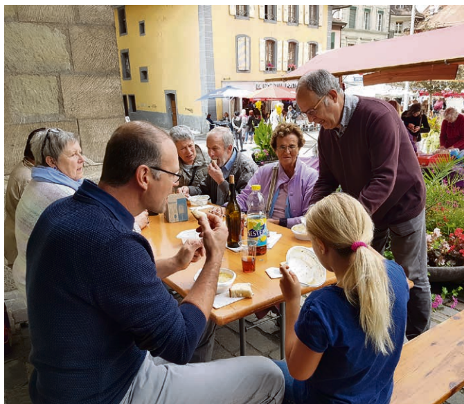
Moudon - Syens Marché moudonnois: qu'elle était bonne la soupe du parvis, et qu'il était bon de la partager avec vous !

Ont été baptisés, au nom du Père, du Fils et du Saint-Esprit à l'église Saint-Etienne, à Moudon : Léon et Samuel Kolypczuk le 10 septembre, Onisha et Teeyah Mvulu le 24 septembre.