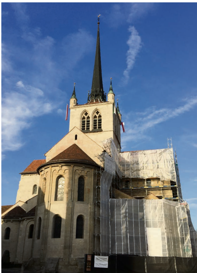
Pacore Clin d'œil sur l'abbatiale en cours de ravalement.

La Réforme a donné naissance à une myriade d'Eglises différentes à travers le monde, selon que l'on met l'accent sur telle ou telle chose dans la Bible. La manière de vivre le culte peut beaucoup varier, mais nous sommes les branches d'un même tronc, et nous avons les mêmes racines : Jésus-Christ est le chef de l'Eglise, et nous entendons sa Parole à travers la Bible. Nous voulons manifester cette force qui nous unit. Au moins quatre communautés se rassembleront à Payerne le 12 novembre pour un culte commun. Soyez-y les bienvenus !